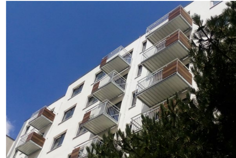
Moderne Stahlbalkons mit kombinierter Ausfüllung, Bratislava, Slowakei