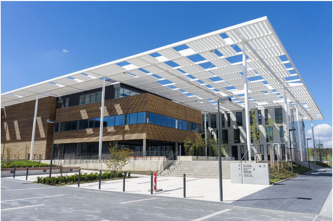
Die Stahlkonstruktion der Abschirmung für Laser-Zentrum ELI Beams in Dolní Břežany, Tschechien

Die Gesellschaft Abadia a.s. gewährt Komplexdienste im Bereich des Entwurfes und der Fertigung von geschweißten Stahlkonstruktionen, der Maschinen- und Schlosserfertigung.