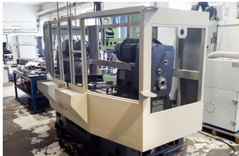
FÜR MASCHINENBAU Abdeckungen der Einzweck-CNC-Maschine