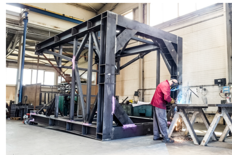
Stahlkonstruktion für technologische Anlagen.