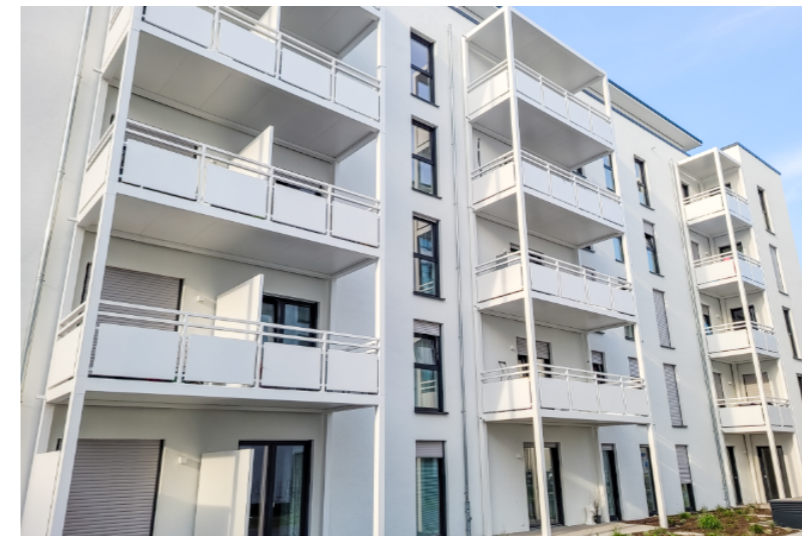
Freitragende Balkone nach unserer Konstruktion - Darmstadt, Deutschland.