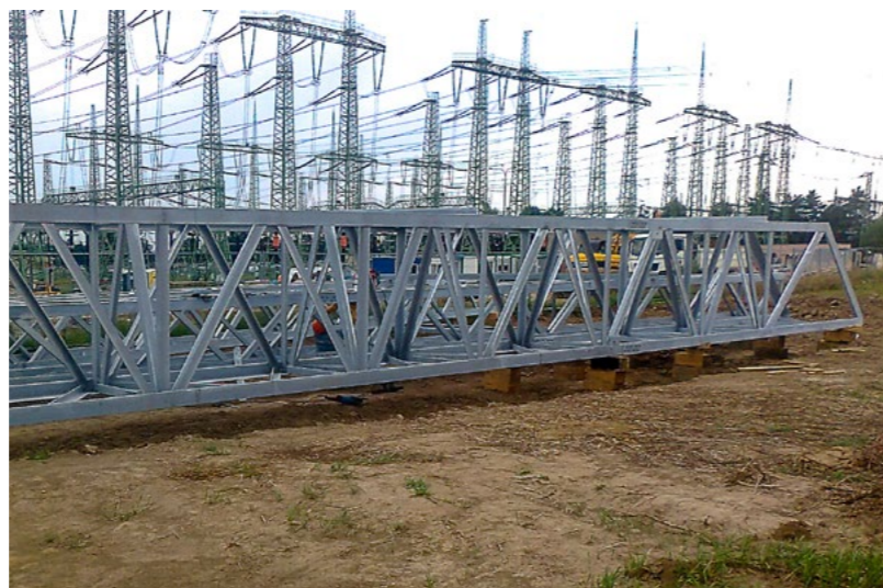
FÜR ENERGETIK Säulen, Balken und Masten für die Schaltanlage in Prosenice, Tschechien